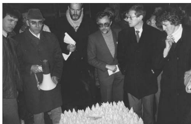
Les visiteurs dans la salle de forçage : le forçage sans terre en bac hydroponique.

H.B. — Oui, cela peut arriver, mais certaines d'entre elles ne sont pas liées au système de production lui-même. La seule façon de faire de l'endive de qualité, en hydroponique, est de respecter les températures de forçage et surtout les durées de forçage. Or actuellement, les endiviers sont pris dans un ensemble de