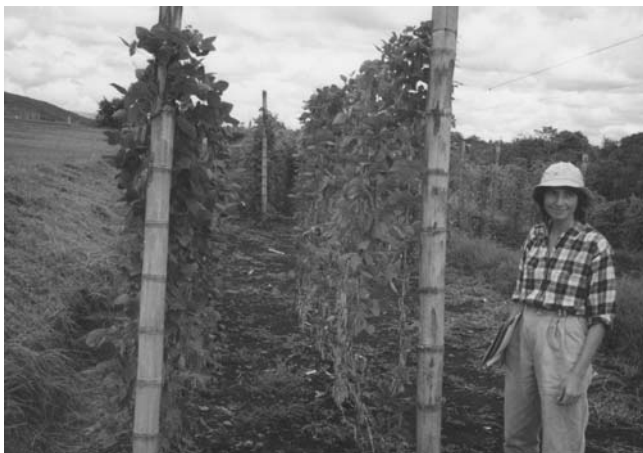
Production de haricots à rames pour les grains en Colombie.

H.B. — L'espèce sauvage est originaire de l'Amérique du Sud et de l'Amérique centrale. On trouve encore certains de ses représentants dans deux zones géographiques bien séparées : la première dans la partie de la cordillère des Andes située au nord de l'Argentine, la seconde sur les hauteurs situées au Mexique. Les haricots qui viennent de ces contrées se distinguent entre eux par des caractères morphologiques et biochimiques, à la suite d'une séparation sans doute très ancienne, antérieure au processus de domestication.