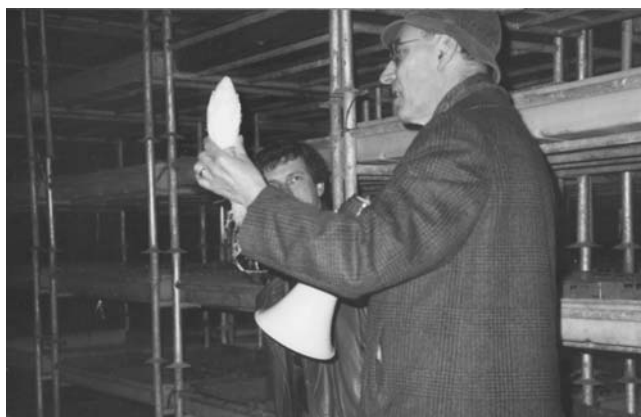
Vue de la salle de forçage.

pas à ce qu'on bouleverse le système de forçage. Mal préparés à produire des semences, nous nous y sommes mis malgré tout. Nous souhaitons produire des semences techniquement bonnes. Mais les champs mis à notre disposition étaient souvent infects. Il fallait d'abord faire une rangée d'un parent, une autre avec l'autre parent. C'était difficile ! Il fallait "faire du planchon", c'est-à-dire un semis d'août destiné à rester en place durant l'hiver pour être repiqué en pépinière, au printemps. Il faut reconnaître que nous sommes allés souvent au début dans le brouillard.