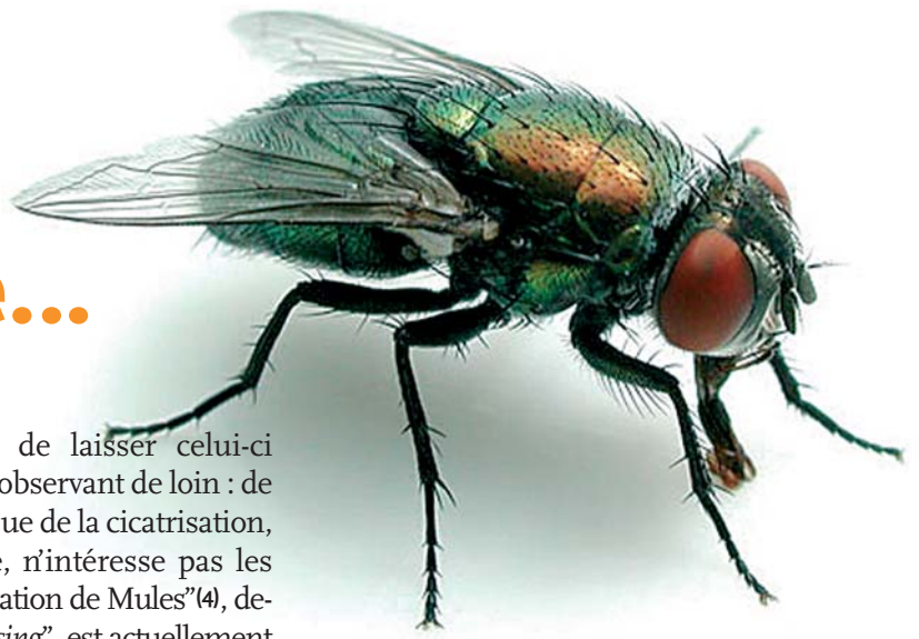
Lucilia cuprina

... L oin de tuer les mouches à cent pas (1) , les attire et provoque, chez le mouton australien, particulièrement au Queensland, une myiase très grave : l'animal est dévoré sur pied par les asticots de la Lucilie cuivrée australienne (2) , Lucilia cuprina (Diptère Calliphoridae). L'imago est particulièrement attiré par les replis de peau laineuse, humides et malodorants (régulièrement souillés d'urine et contaminés par une bactérie qui produit une odeur attire-mouches supplémentaire) autour du périnée ; la larve est une spécialiste des tissus vivants (3) . En 1931, un éleveur du nom de J.W.H. Mules, en réaction à un article prônant la sélection de moutons sans replis de peau pour échapper aux ravages de la Lucilie, publie sa méthode dans l'Adelaide Advertiser . Il s'agit d'enlever (avec pour outils une pince à castrer et une lame bien aiguisée) les plis périnéaux de l'agneau (de 2 à 6 se-