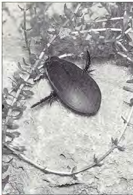
Cybister lateramarginalis est un dytique carnivore dont la présence atteste de la bonne santé du milieu.

Depuis 1982, la France a lancé un programme d'inventaires ZNIEFF (Zones Nationales d'Inventaires Faunistiques et Floristiques) ; 14 300 zones d'intérêt écologique ont été recensées mais aucune mesure légale et spécifique de protection n'est envisagée. Les "zones humides" sont nombreu-