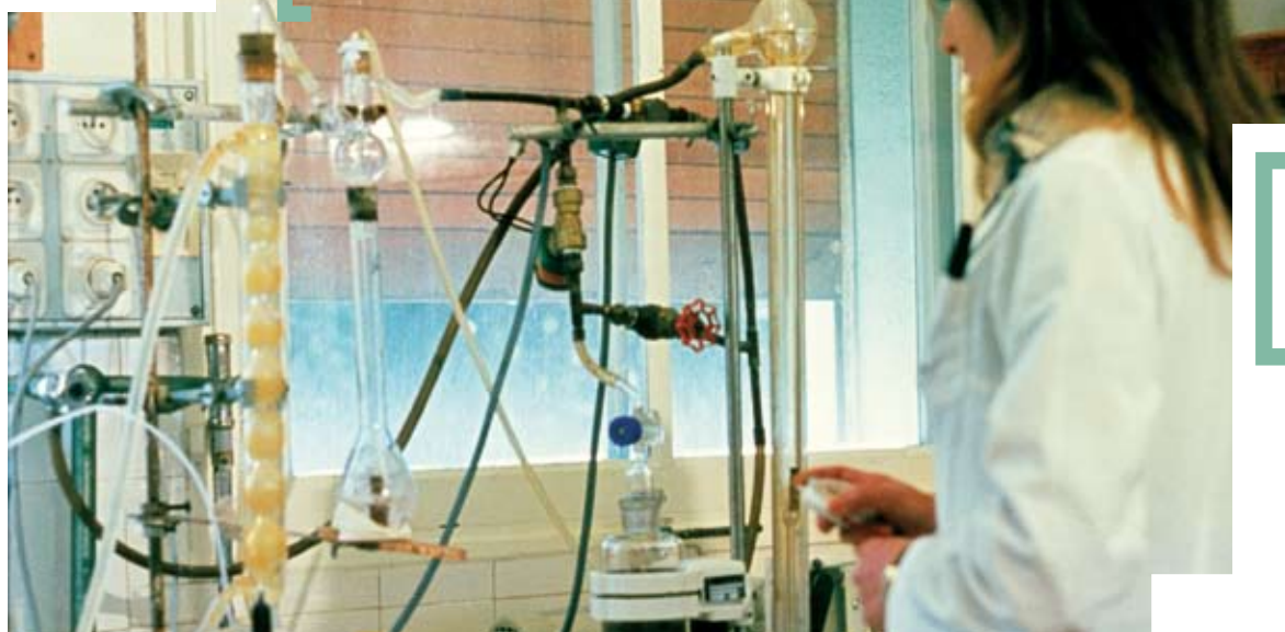
Études de procédés de fabrication alimentaire.

L'Inra est le premier organisme européen de recherche agronomique, par ses productions scientifiques en sciences de la vie et de l'environnement tout particulièrement. Organisme public, il est placé sous la tutelle des ministères en charge de l'Agriculture et de la Recherche.