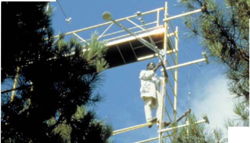
Mesure des transferts de chaleur et de vapeur d'eau dans et au-dessus d'une forêt de pins maritimes. L'Inra étudie les impacts du changement climatique sur la forêt.

Le fonctionnement des écosystèmes cultivés, forestiers et naturels, terrestres et aquatiques, la protection des ressources et la gestion de l'espace rural sont des objets de recherches majeurs pour l'Inra. L'amélioration de l'environnement est un enjeu prioritaire pour l'avenir des activités de production qui valorisent les espaces et les territoires ruraux.