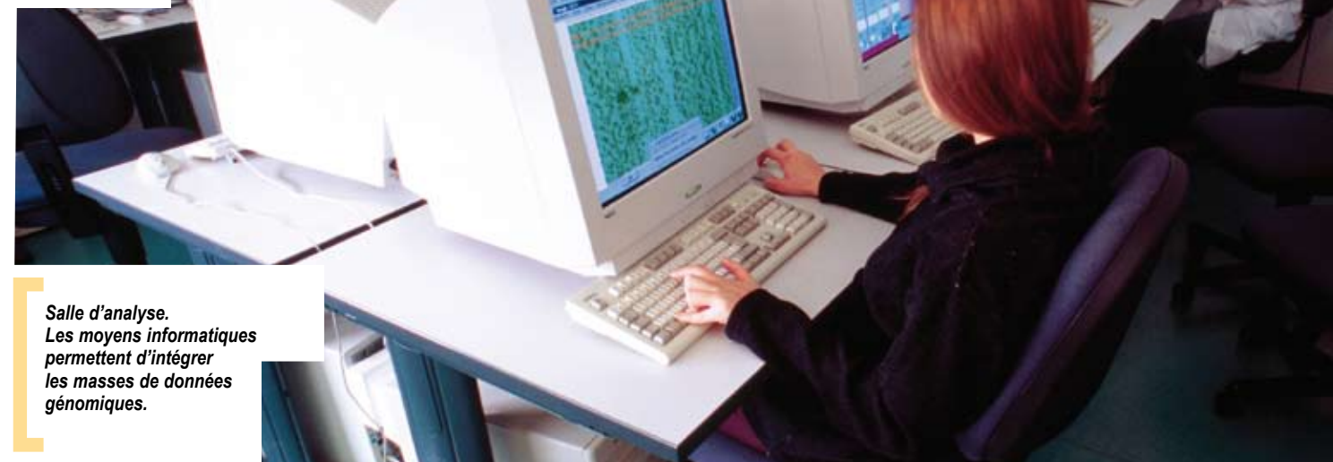
Salle d'analyse. Les moyens informatiques permettent d'intégrer les masses de données génomiques.

Participer aux avancées de la biologie, en explorer et en maîtriser les méthodes et connaissances les plus récentes, permettent à l'Inra d'apporter des contributions fondamentales aux problématiques de la recherche agronomique, notamment dans les domaines relatifs à l'organisation, au fonctionnement et à l'évolution des génomes, au développement, à l'adaptation, à la physiologie et à la physiopathologie des organismes.