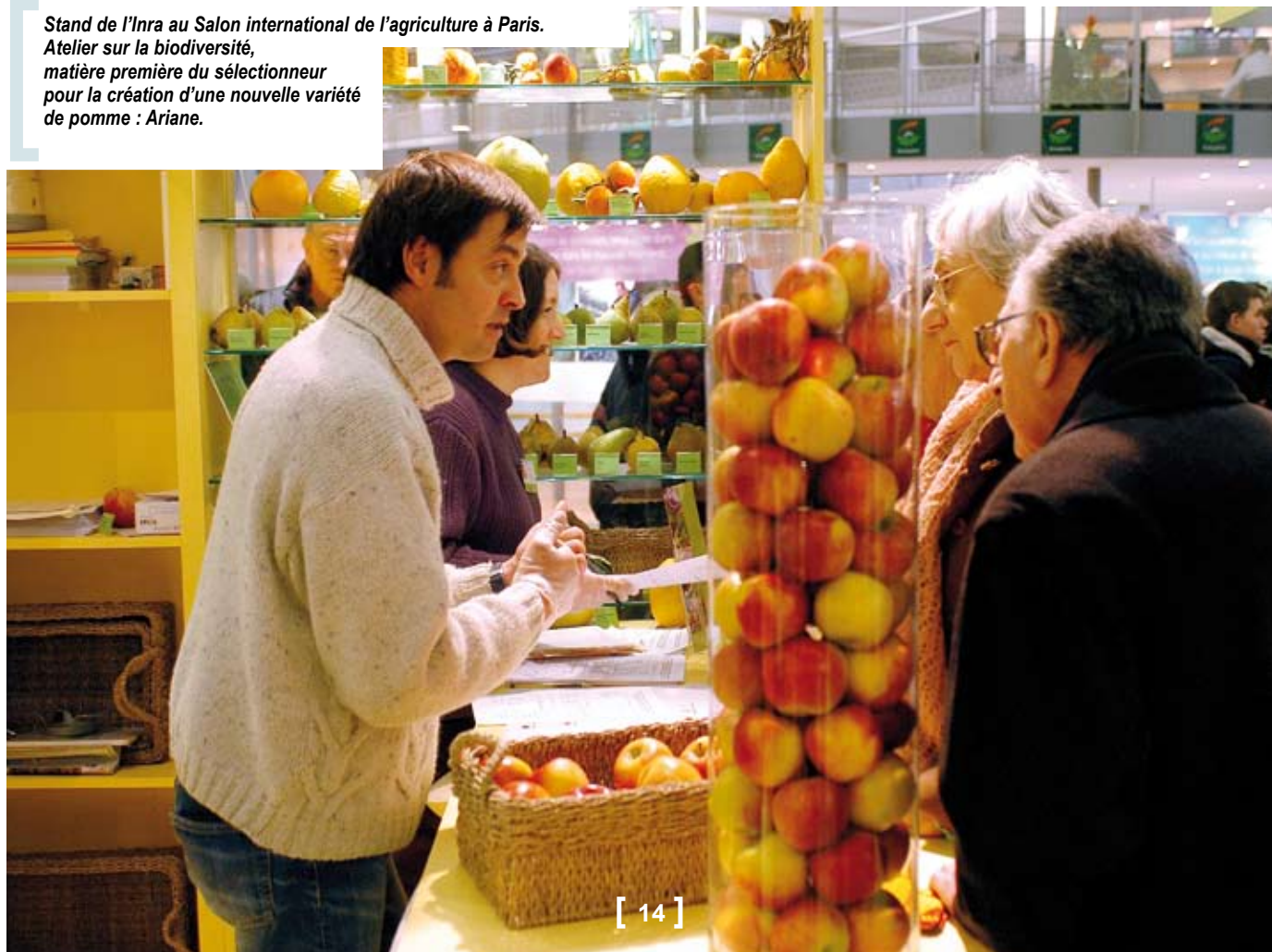
Stand de l'Inra au Salon international de l'agriculture à Paris. Atelier sur la biodiversité, matière première du sélectionneur pour la création d'une nouvelle variété de pomme : Ariane.

L'Inra se doit de mieux faire connaître ses activités et leurs enjeux auprès du grand public et des décideurs. L'Institut va renforcer ses actions d'information et de communication avec les acteurs nationaux de la médiation scientifique (réseau des centres de culture scientifique et technique). Il développera des actions pédagogiques en partenariat avec l'Éducation nationale, l'enseignement agricole et les associations d'éducation à l'environnement et au développement durable. Enfin, il diffusera davantage d'articles et d'ouvrages de synthèse destinés à un public large.