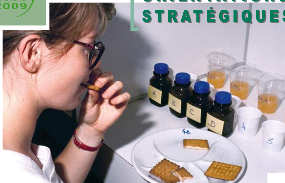
Tests relatifs à l'entraînement d'un jury d'analyse sensorielle : reconnaissance de goût.