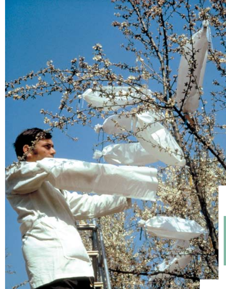
Pose de sachets d'isolation après pollinisation artificielle.

L'Inra participe activement à l'enseignement supérieur : plus de 1 000 enseignants-chercheurs travaillent au sein des unités mixtes. Les scientifiques de l'Inra ont dispensé 20 000 heures de cours au sein des écoles agronomiques et vétérinaires, et dans les universités en 2004. L'Inra accueille 1 200 doctorants (en 2005) et contribue de plus en plus à l'animation de certaines écoles doctorales.