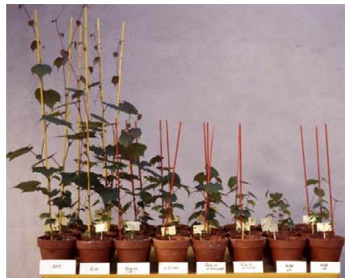
Influence de champignons symbiotiques sur la croissance de la vigne